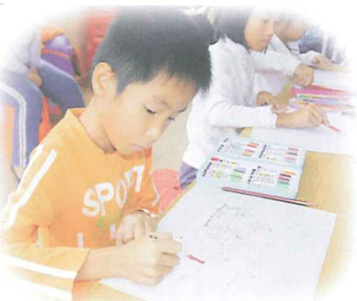
孩子们在专心画画